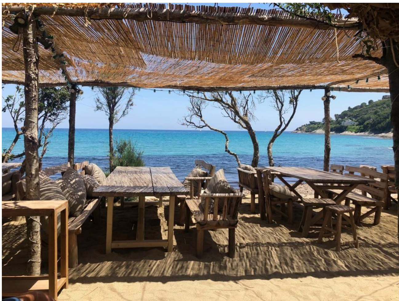
La plage de l'hôtel

Alain Delon, Romy Schneider, et surtout Serge Gainsbourg y ont passé leurs vacances, loin des feux de la Côte d'Azur.