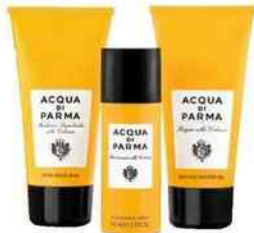
Set nomade contenant les essentiels de la marque Acqua di Parma, 47 €.