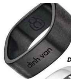
Bague Zen en titane, Dinh Van, 490 €.