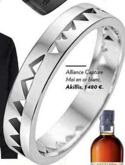
Alliance Capture Moi en or blanc, Akillis, 1480 €.