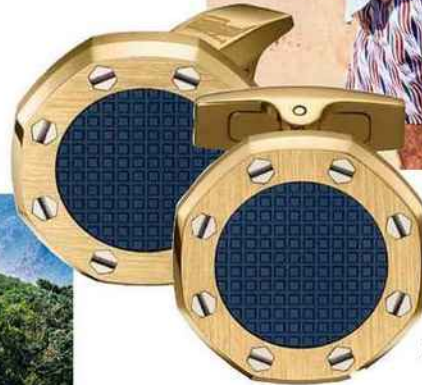
Boutons de manchette en or inspirés de la Royal Oak, Audemars Piguet, 3700 €.