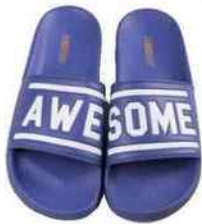
Claquettes à message, The White Brand aux Galeries Lafayette, 39 €.

Par Hervé Borne, Martine Cohen et Tiphaine Menon @tiphainemenon