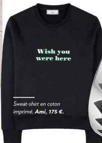
Sweat-shirt en coton imprimé, Ami, 175 €.