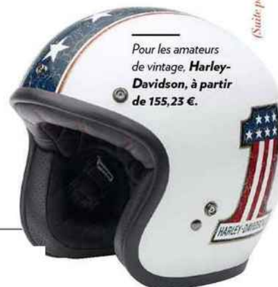
Pour les amateurs de vintage, Harley- Davidson, à partir de 155,23 €.