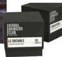
Des infusions de caractère, Herbal Drinkers Club, 34 €.

Du jeudi 14 au dimanche 17 juin, pass 4 jours, 60 € en prévente. wheels-and-waves.com .