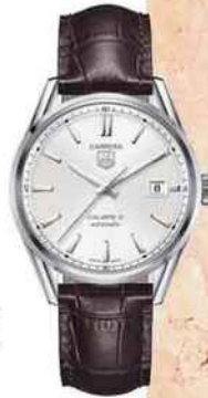
Carrera en acier, 39 mm, automatique, bracelet en alligator, TAG Heuer, 2150 €.