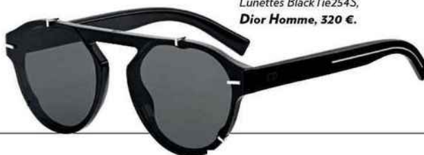
Lunettes BlackTie254S, Dior Homme, 320 €.