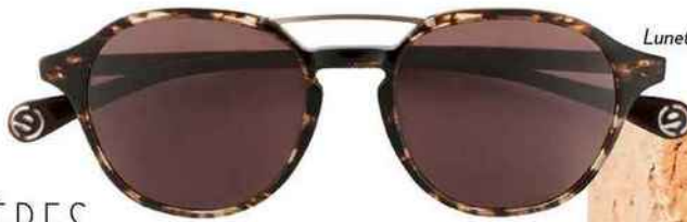
Lunettes de soleil en résine et acétate, Elite Eyewear en exclusivité pour Optic 2000, 99 €.