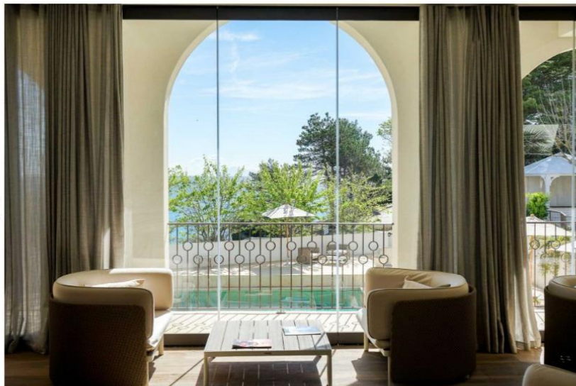
Vue sur la piscine depuis le bar de l'hôtel Misincu

Depuis l'été 2017, Misincu s'est imposé comme l'un des plus beaux hôtels de Corse. Ce boutique-hôtel confidentiel (53 chambres, 7 villas) déploie ses charmes entre mer et maquis, au cœur d'un immense domaine dans la région la plus sauvage de l'île. Avec, en prime, une démarche environnementale audacieuse.